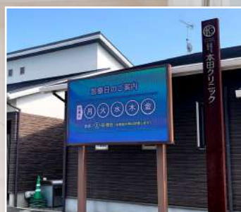
熊本 / 本田クリニック様