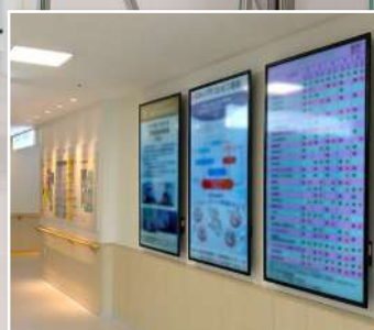
佐賀 / 佐賀大学医学部附属病院様