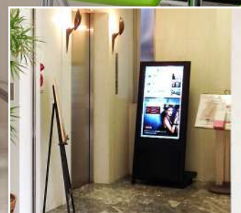
神奈川 / 高野クリニック様