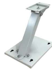
ユーソニックミニ 標準設置台 USONIC-mini-STD オープン価格