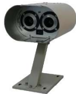
ユーソニックミニ 標準設置台付 USONIC-mini-B1 オープン価格