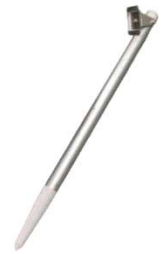
ユーソニックミニ 杭設置台 USONIC-mini-PKT オープン価格

※商品は販売代理店を通してのお見積り、販売させていただいております。 取扱い代理店がご不明な場合は、別途ご紹介させていただきますので、当社までお問い合わせください。