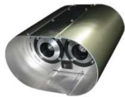
ユーソニックミニ 本体 USONIC-mini-B0 オープン価格